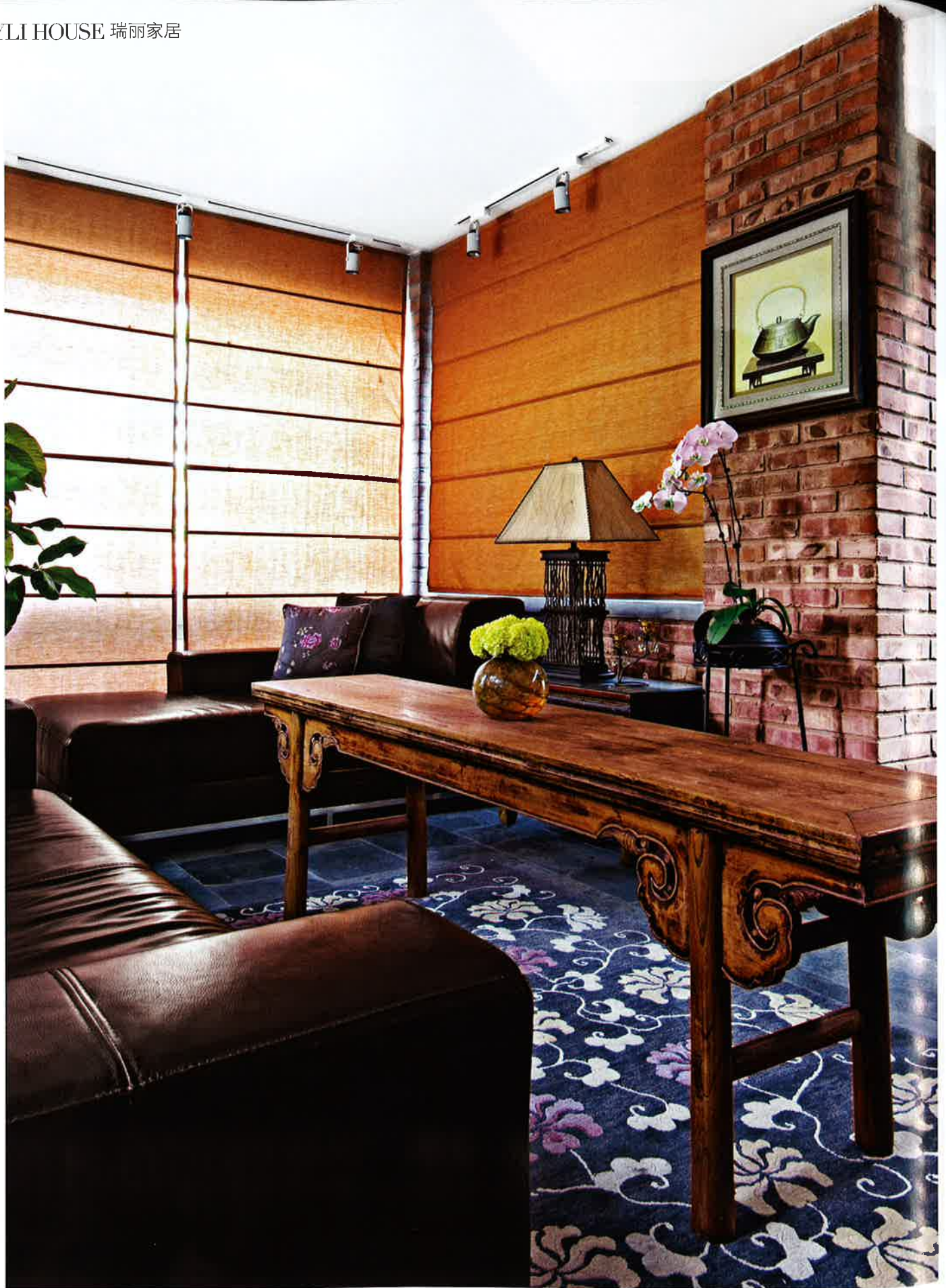
客厅一角中式地毯茶桌和西式牛皮沙发的混搭。