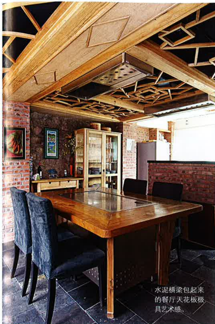
水泥横梁包起来的餐厅天花板极具艺术感。